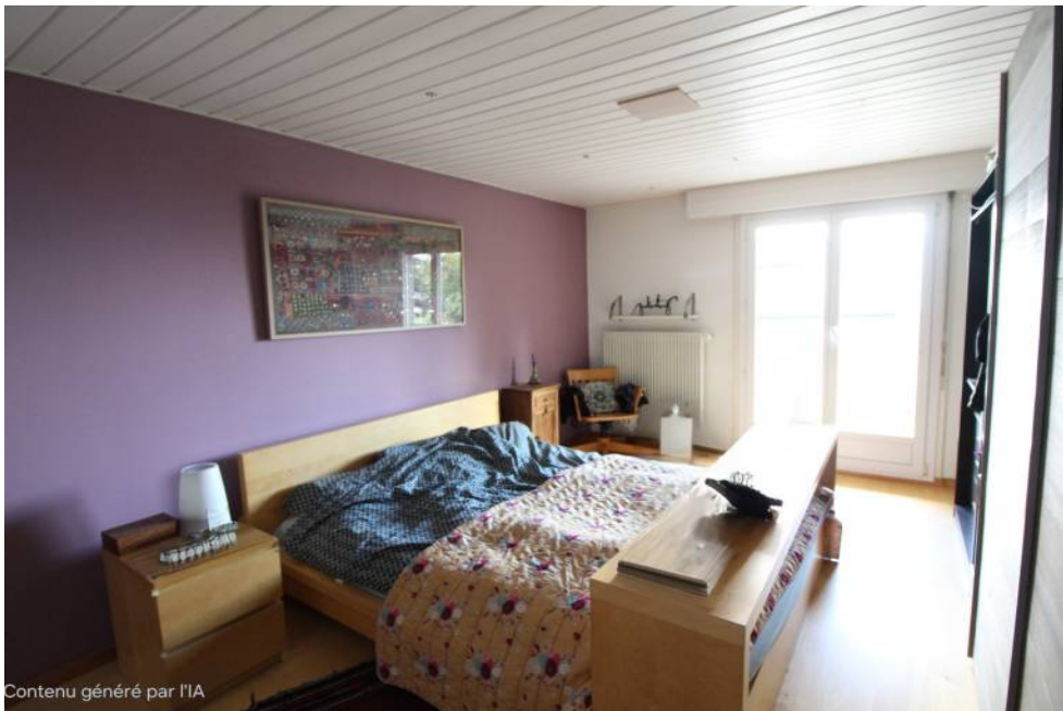
Contenu généré par l'IA